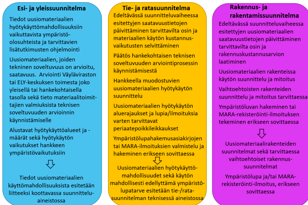
Kuva 1. Yleispiirteinen kuvaus uusiomateriaalien hyötykäytön edistämisestä maanteiden, rautateiden ja vesiväylien suunnittelun eri vaiheissa.